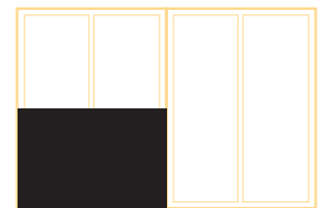
Halbe Seite quer